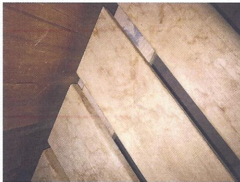
Abbildung 1 - Vor der Reinigung